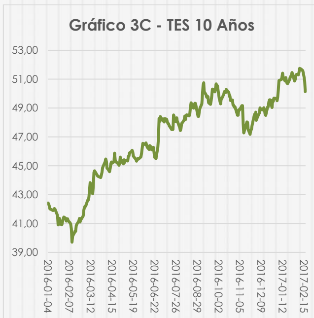
Gráfico 3 - Título de Tesorería (TES) de Colombia (en pesos) con maduración a uno, cinco y diez años