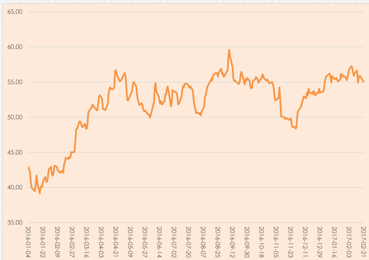
Gráfico 1 - COLCAP (Ene 2 2014 =100)

En efecto, $100 dólares invertidos en la canasta COLCAP el 2 de enero de 2014 se han diluido a $55.04 dólares al 21 de febrero de 2017: una pérdida de valor del 44.96%.