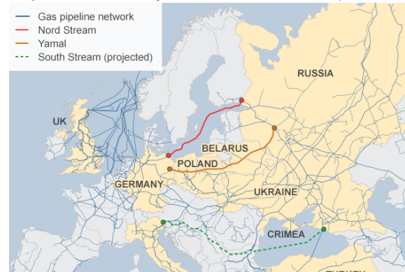
Mapa 1: Red de Gas y Petróleo de Rusia a Europa

Rusia, sin embargo excusada en una deuda de entre 3.1 y 4.5 billones de euros que tenía el Estado Ucraniano y de la cual era acreedora Gazprom, la mayor empresa de recursos energéticos de Rusia, cortó el suministro de gas en junio hacia Ucrania