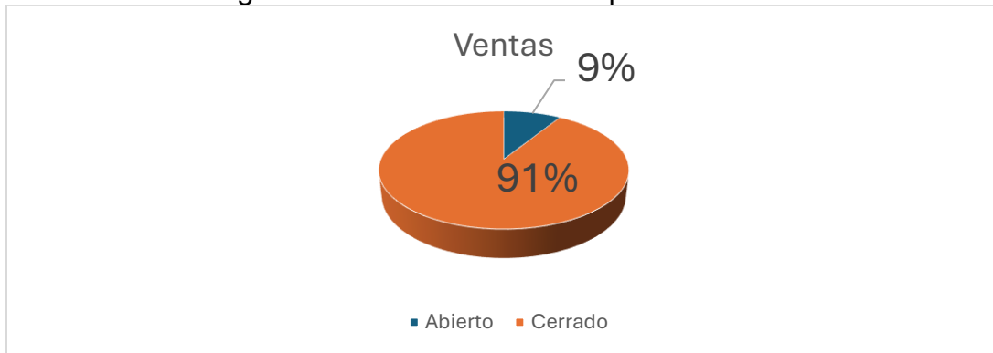
Figura 3 – Distribución ventas por modalidad

desarrollo de soluciones formativas especializadas para organizaciones públicas y privadas.